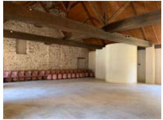
La salle de la Cuverie (1ère cour - RDC)