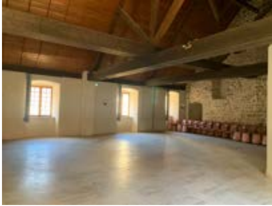
La salle des Chanoines (3ème cour - 1er étage)